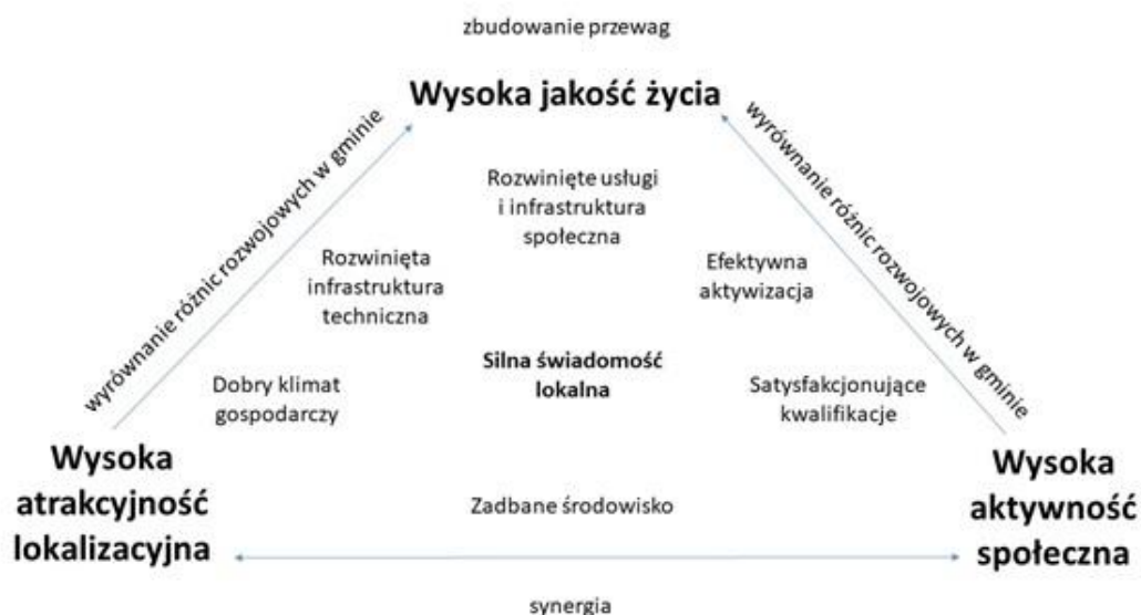
Rysunek 1. Układ celów strategicznych i operacyjnych